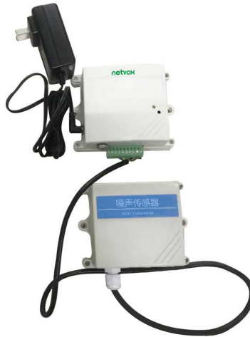
图一 RA0724 效果图 (以实物为准)